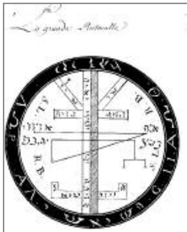
El gran pantáculo , Manuscrito Lansdowne 1203 (1641), British Library.

clandestina por España en los siglos XVII y XVIII, pese a las prohibición eclesiástica y la vigilancia inquisitorial.